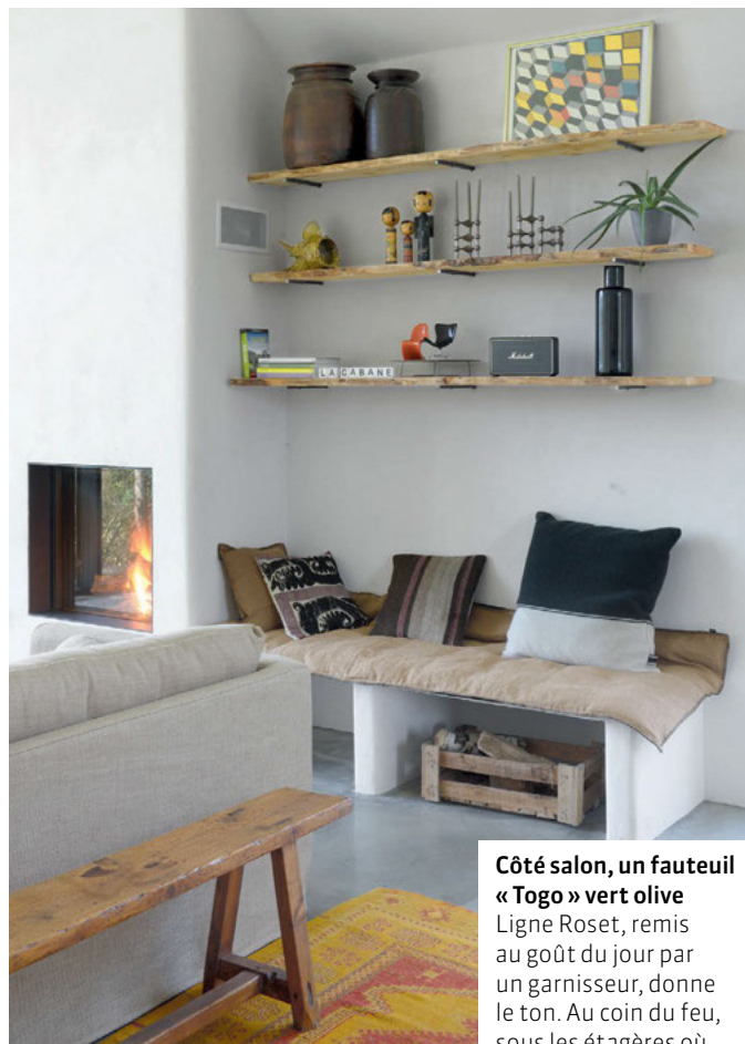
Côté salon, un fauteuil « Togo » vert olive Ligne Roset, remis au goût du jour par un garnisseur, donne le ton. Au coin du feu, sous les étagères où se côtoient des pièces hétéroclites attirant la curiosité, une banquette cimentée et parée de coussins Libeco appelle au lâcher-prise.